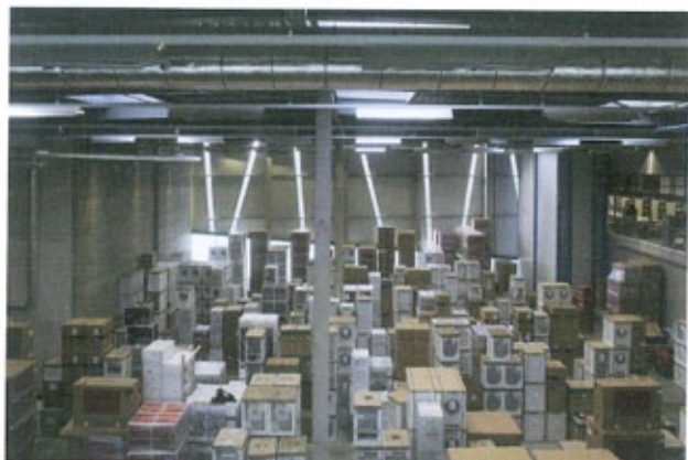
De inpakruimte grenst aan de enorme opslaghal waar het licht via smalle stroken glas binnenvalt.