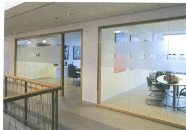
De gang in de kantoorvleugel wordt gekenmerkt door houten details.