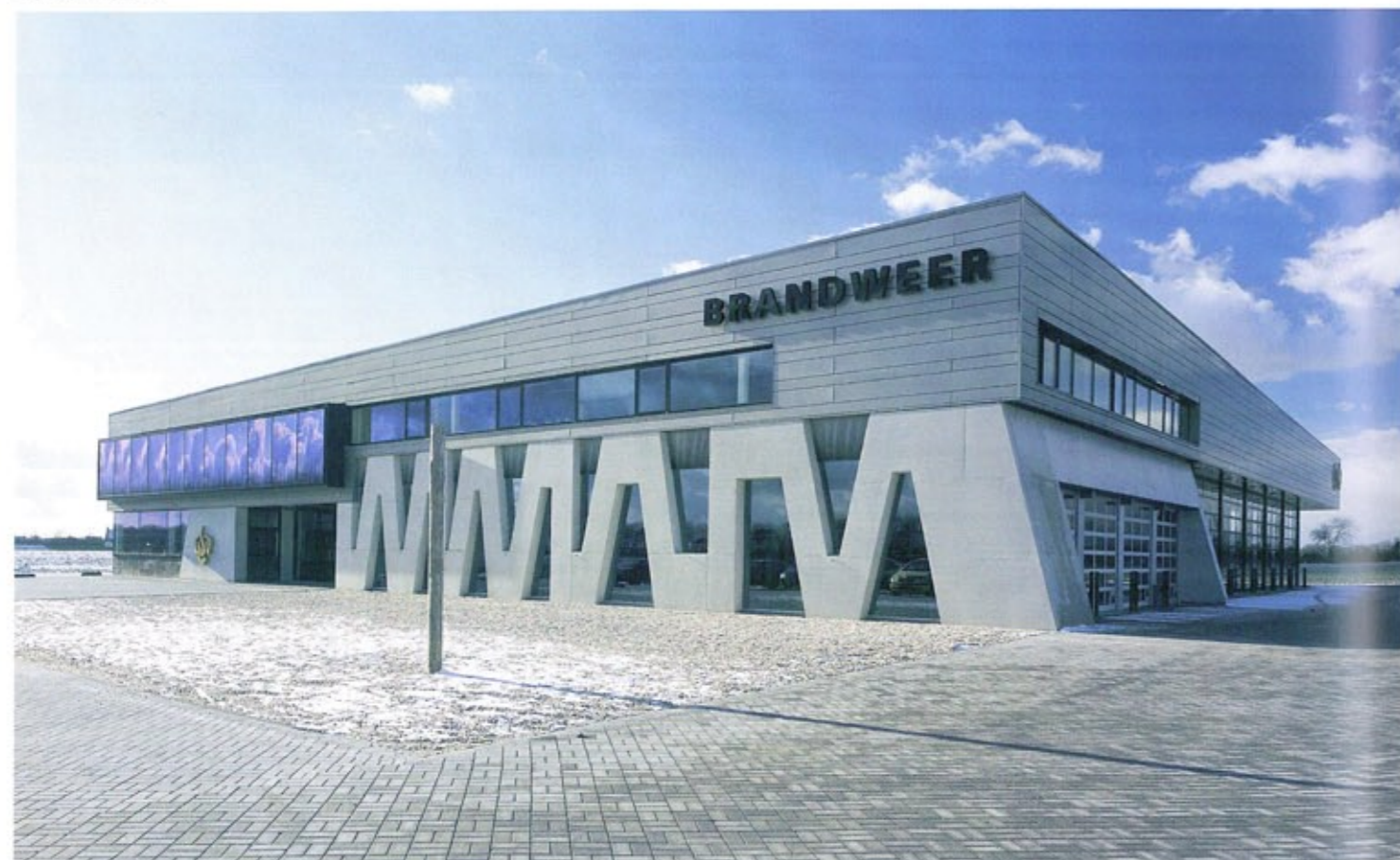
Ansicht von Nordosten | View from the north-east