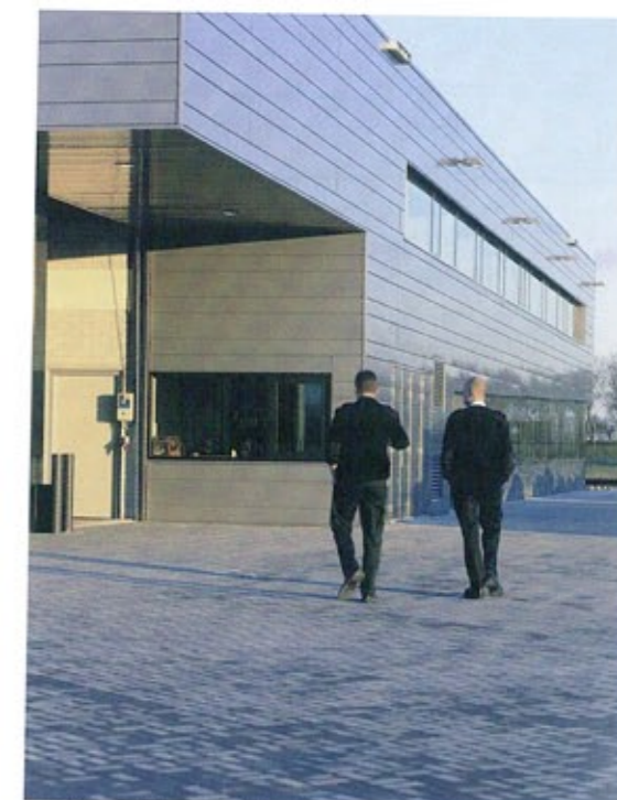
Ansicht von Südwesten | View from the south-west