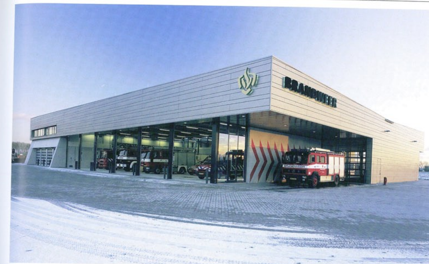
Ansicht von Nordwesten | View from the north-west

Kantine, die Lehrräume, der Raum des Kommandanten und der Besprechungsraum wurden als gesonderte Bereiche behandelt. Die Kantine liegt im Zentrum des Gebäudes; von dort aus kann man alle internen Aktivitäten überschauen. Die anderen drei Räume wurden in einer leicht hervorstechenden, verglasten Box mit Blick auf die Umgebung untergebracht. Alle für das effiziente Ausrücken der Rettungskräfte wichtige Einrichtungen und Funktionen befinden sich übersichtlich organisiert im Erdgeschoss. Unterschiedlich geneigte Dächer und große Kragträger verleihen dem Gebäude seine charakteristische skulpturale Erscheinung und verknüpfen es mit der Landschaft. Der Baukörper wird durch einen großen, zick-zack-förmigen Gussblock aus Beton, der wie ein bewegliches Gitter erscheint, gestützt. Mit der Abstraktion der Buchstaben V und M soll deutlich gemacht werden, dass die Rettungswache die Feuerwehren von Vlissingen und Middelburg beherbergt.