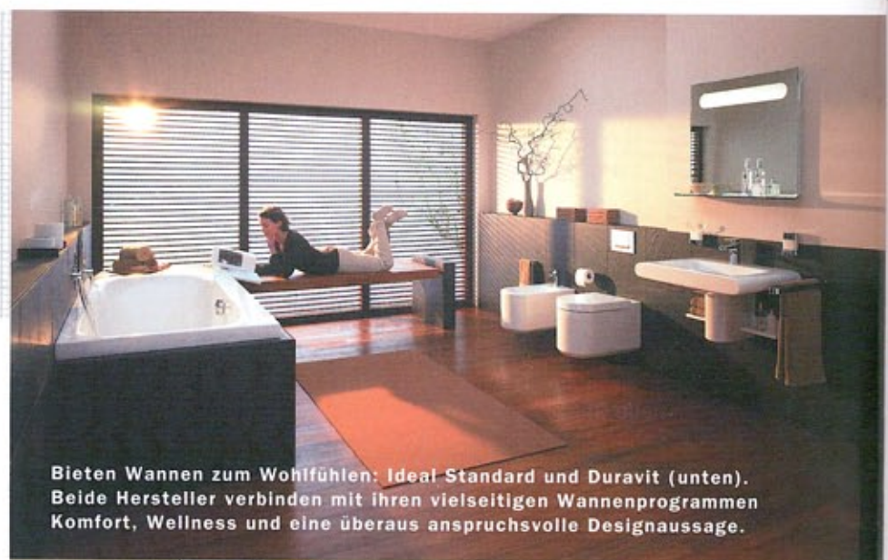
Bieten Wannen zum Wohlfühlen: Ideal Standard und Duravit (unten). Beide Hersteller verbinden mit ihren vielseitigen Wannenprogrammen Komfort, Wellness und eine überaus anspruchsvolle Designaussage.

FÜNF TAGE lang (6. bis 10. März) dreht sich in Frankfurt alles um Wasser, Wärme und Luft. Die ISH, Weltleitmesse Bad, Gebäude-, Energie-, Klimatechnik, Erneuerbare Energien, bildet die Innovationskraft einer Branche ab, die sich im Aufwind befindet. Schließlich ist der Renovierungsbedarf gerade in Sachen Nasszelle so hoch wie noch nie in Deutschland. Und auch das Thema Wellness mit all seinen relaxenden und erfrischenden Facetten ist beim Verbraucher nach wie vor angesagt. Erwartet werden in Frankfurt 2300 Aussteller aus aller Welt, die auf 250.000 Quadratmeter ihre Neuheiten präsentieren. Die Stärke der ISH, ihr konsequentes Verbundsystem, kann dabei auf dem gesamten Gelände ausgespielt werden. Besonders fresh wird es diesmal in der Erlebniswelt Bad zugehen. In den Hallen 1, 3, 4 sowie im Forum und in der Festhalle wird Wasser in seiner schönsten Form inszeniert.